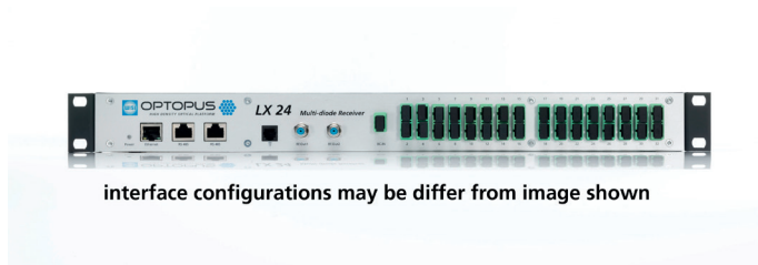
interface configurations may be differ from image shown